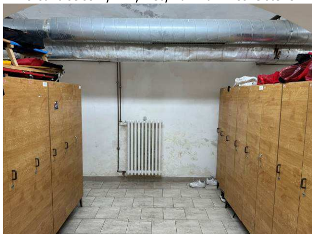
Foto č.15 – uliční obvodová stěna v prostoru šaten vedle kotelny s viditelnými vlhkostními mapami a se sprašováním povrchů včetně solných výkvětů