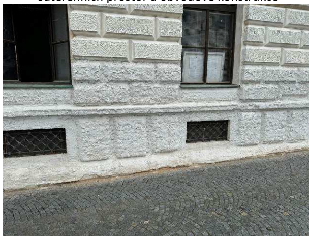
Foto č.4 – pravá část uliční fasády od hlavního vstupu s provedenými obětovanými omítkami