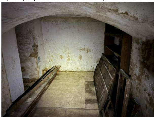
Foto č.10 – degradace omítek v plném rozsahu v prostorech napravo od vnitřního schodiště