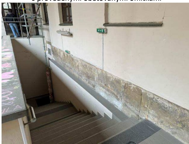
Foto č.6 – vstupní dvorní schodiště do suterénu v severozápadní části dvora