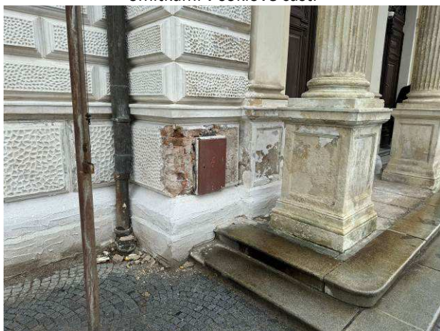
Foto č.3 – stávající dešťové svody osazené lapači splavenin, degradace povrchových úprav na pilířích