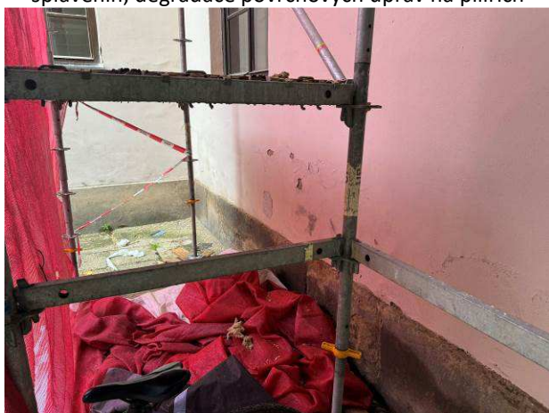
Foto č.5 – degradace povrchových úprav v nadsoklové části dvorní fasády v severozápadní části