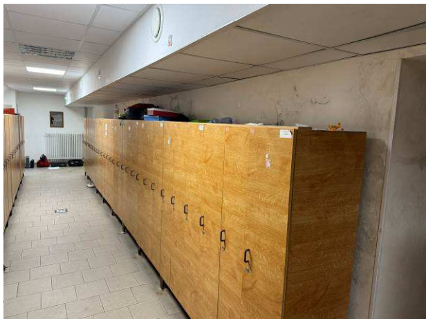
Foto č.13 – degradace povrchových úprav v plném rozsahu se solnými výkvěty na vnitřní nosné stěně