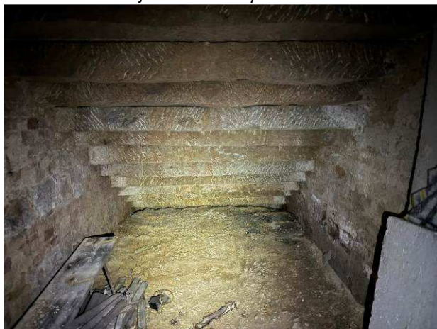
Foto č.11 – podschodišťový prostor s charakterem suterénního zdiva