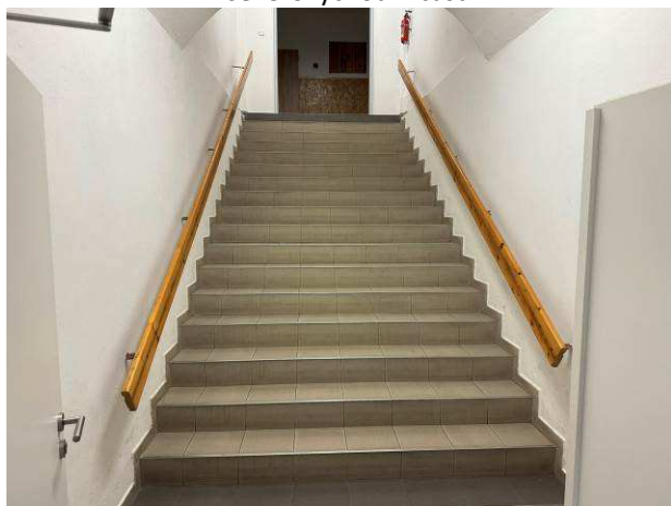
Foto č.9 – vnitřní schodiště do suterénních prostor s projevy vlhkosti ve spodní úrovni bezprostředně nad stávajícím keramickým soklíkem