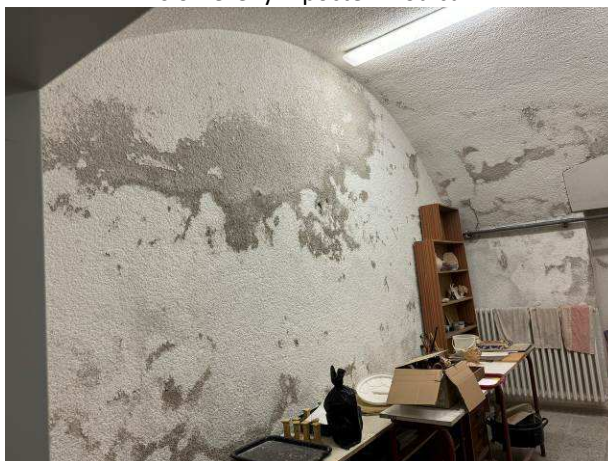
Foto č.18 – obvodová štítová stěna navazující na uliční obvodovou stěnu s degradací povrchových úprav v plném rozsahu