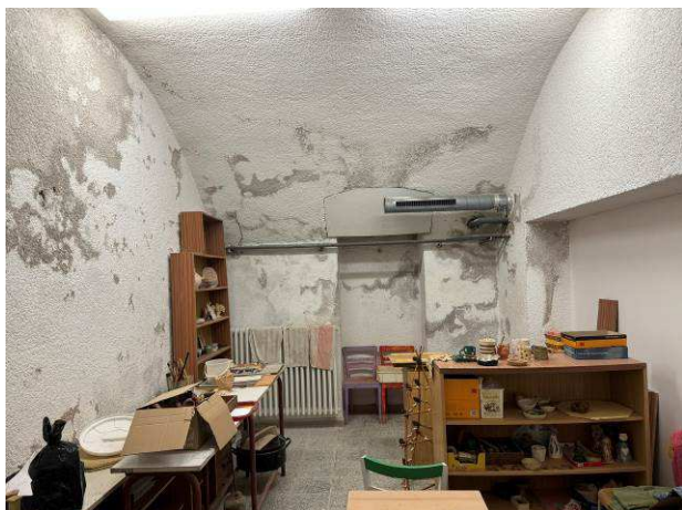
Foto č.17 – viditelné vlhkostní projevy s degradací povrchových úprav stěn a klenb v m.č. 1S06