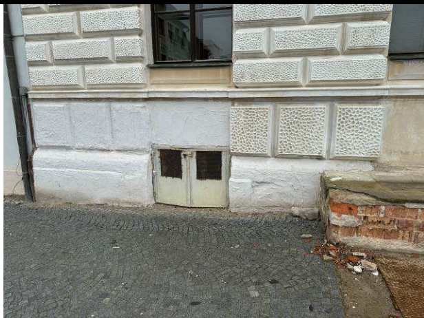
Foto č.1 – pohled na stávající stav části uliční fasády se shozem do kotelny a provedenými obětovanými omítkami v soklové části