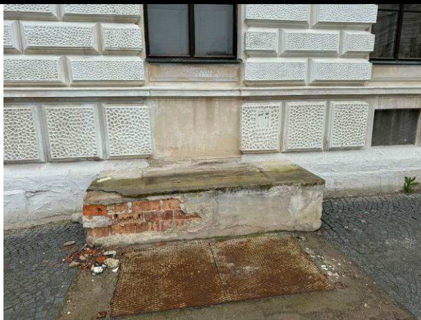
Foto č.2 – stávající výtah do kotelny z uliční strany, kterým dochází při dešťových srážkách k zatékání do suterénních prostor a obvodové konstrukce