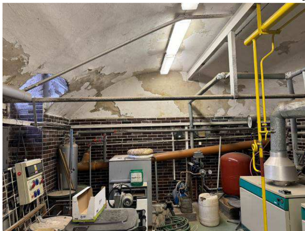
Foto č.14 – degradace omítek stěn a klenb nad stávajícím keramickým obkladem v prostoru kotelny