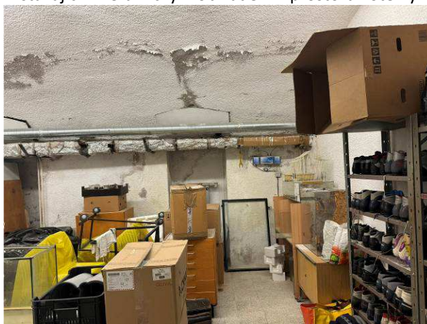
Foto č.16 – degradace povrchových úprav se solnými výkvěty na uliční obvodové stěně a klenbě v m.č. 1S07, dočasně instalovaná technologie elektroosmózy s omezeným počtem vodičů