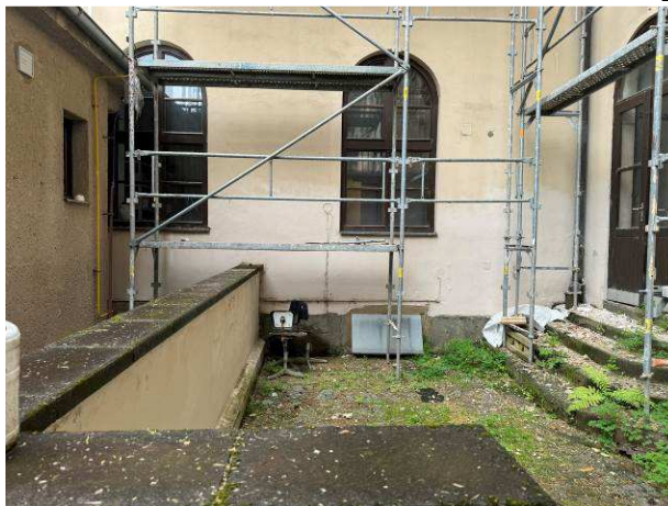
Foto č.8 – celkový pohled na severní fasádu s přístupovým schodištěm v severovýchodní části dvora